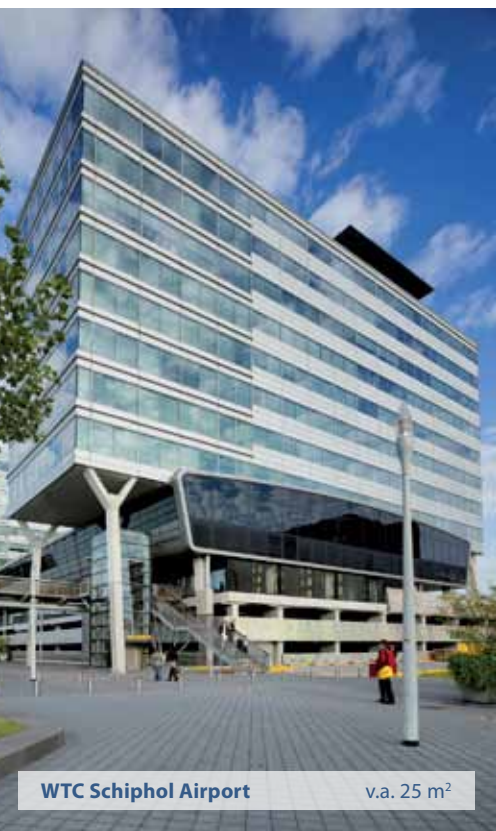
WTC Schiphol Airport