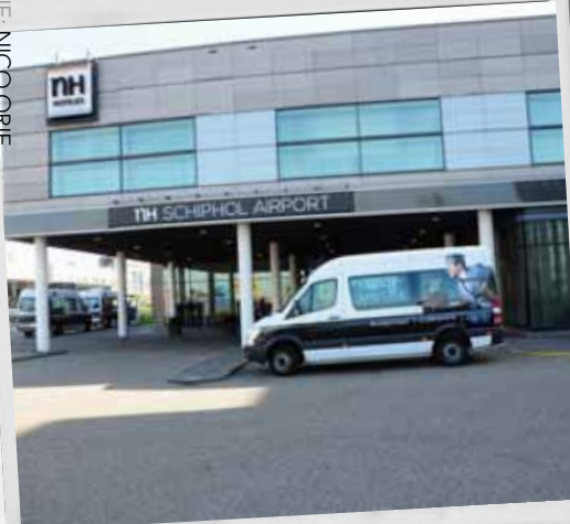
De start bij NH Schiphol Airport te Hoofddorp

TEKST: EILEEN BOSMAN