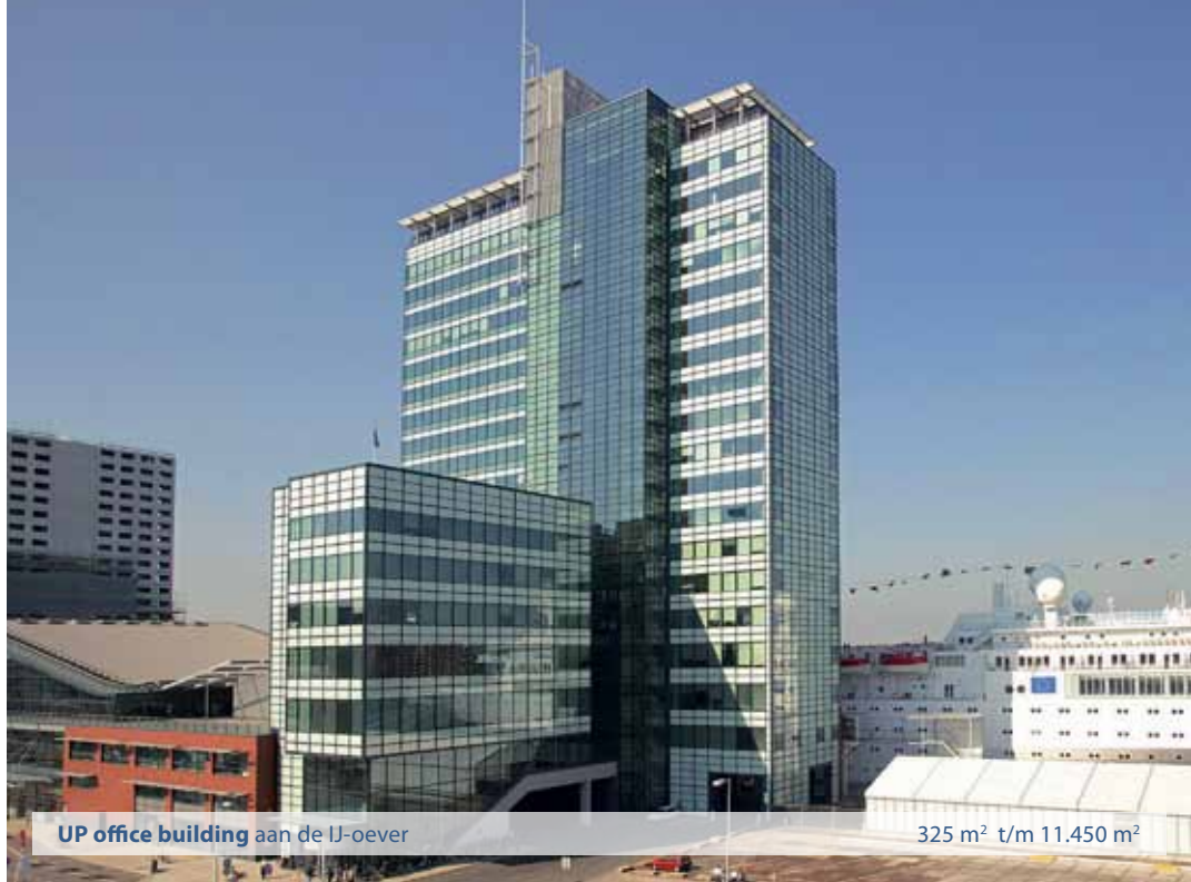
UP office building aan de IJ-oever