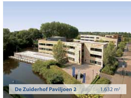
De Zuiderhof Paviljoen 2