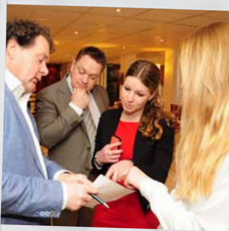
Het uitdelen van de sleutels